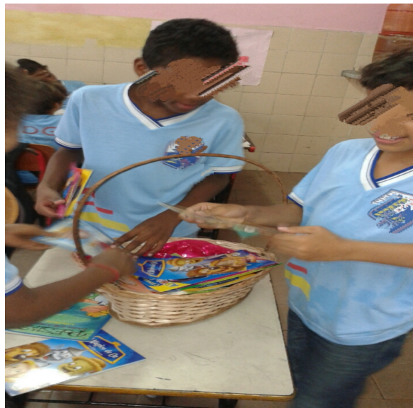
Figura 2 - Leitura Livre

Fonte: Acervo da autora, 13 de novembro de 2014