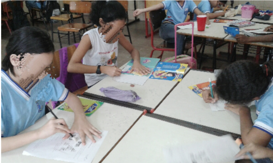
Figura 3 - Produção de texto