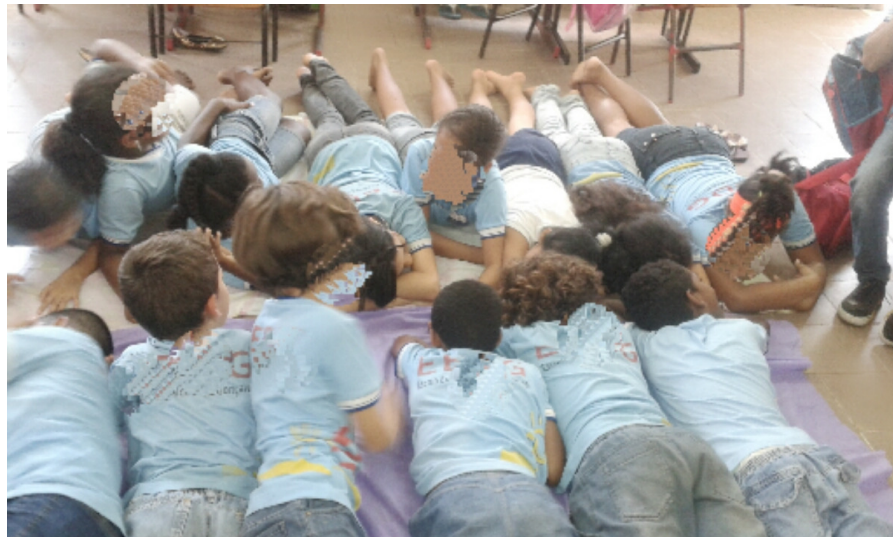
Figura 1 - Dinâmica de integração

Fonte: Acervo da autora, data, 13 de novembro de 2014